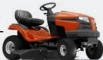
TRAKTOR TS 138L